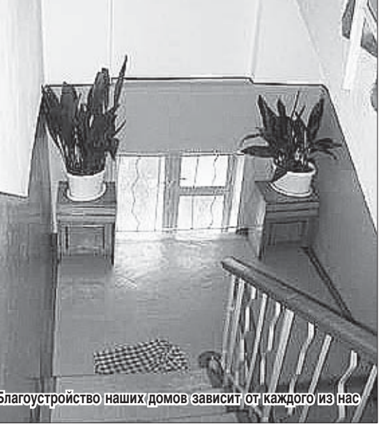
Благоустройство наших домов зависит от каждого из нас

затраты при устранении аварий, неполадок и т. п. Хотим мы этого или нет, но подвальные помещения домов должны быть очищены от мусора и хлама, тем более что накопили его мы, собственники, за многие годы. И никто, кроме нас, эту работу делать не обязан, ведь мусорили мы, а не посторонние. Все равно жизнь заставит нас трудиться, потому что коллективные (общедомовые) приборы учета коммунальных услуг не могут быть установлены в грязных и неухоженных помещениях. Что касается квартирных приборов учета коммунальных услуг (газ, горячая и холодная вода), то каждый собственник решает этот вопрос в индивидуальном порядке.